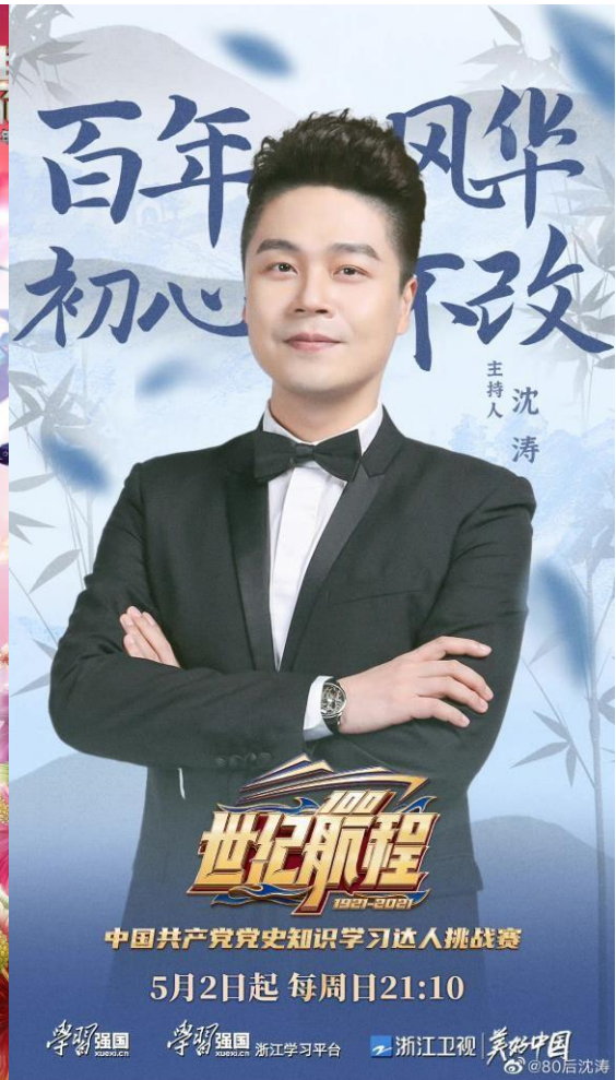
沈涛(셴타오) 절강성 국민 MC